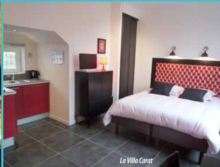
La Villa Carat