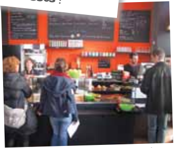
Les meilleurs endroits!

OFFICE DU TOURISME DE ROUBAIX Tél. 33 (0)3 20 65 31 90 | www.roubaixtourisme.com