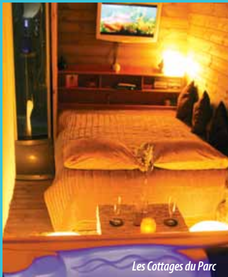
Les Cottages du Parc