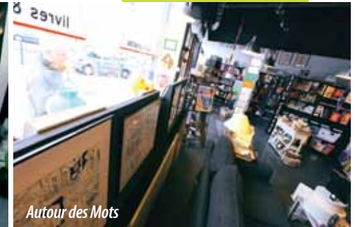
Autour des Mots