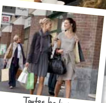
Toutes les bonnes adresses!