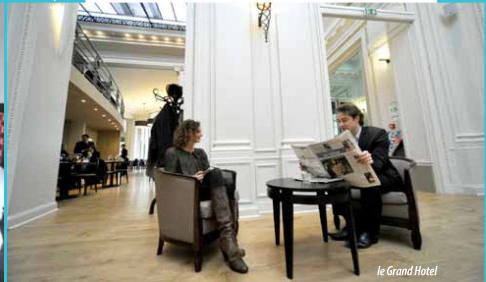
le Grand Hotel