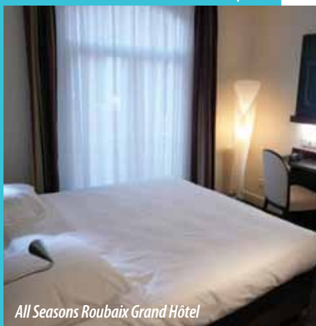
All Seasons Roubaix Grand Hôtel

€ Tarif, à partir de ... 🍳 Petit-déjeuner 🌙 Taxe de séjour