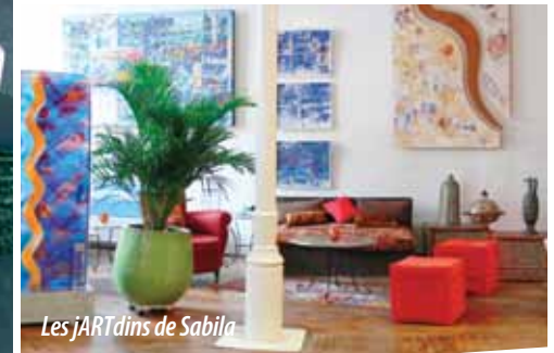
Les jARTdins de Sabila

Retrouvez d'autres lieux d'expo du quartier en page 9